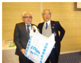
パストガバナー賞