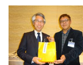
社会奉仕委員長賞