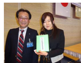
クラブ管理運営委員長賞