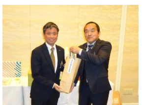
雑誌広報委員長賞