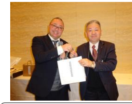
会員維持増強委員長賞