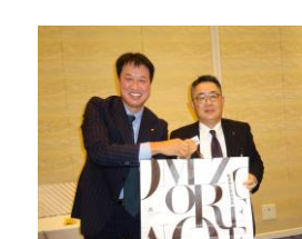
職業奉仕委員長賞