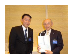
国際奉仕委員長賞