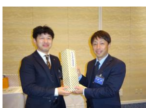
青少年奉仕委員長賞