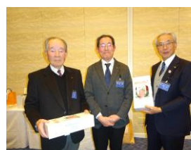
プログラム委員長賞