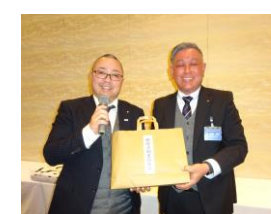
親睦活動委員長賞