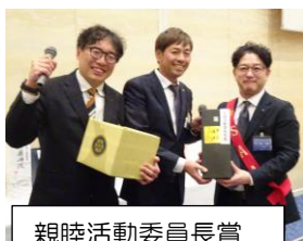
親睦活動委員長賞