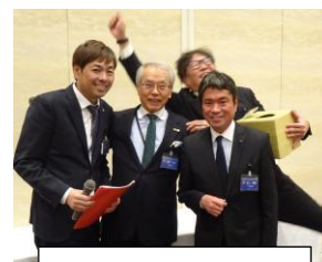
パストガバナー賞