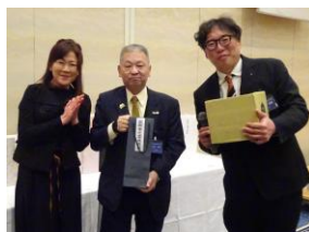
国際奉仕委員長賞