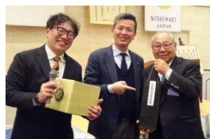
会員維持増強委員長賞