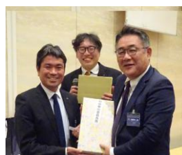
社会奉仕委員長賞