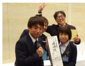
青少年奉仕委員長賞