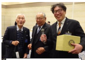
プログラム委員長賞