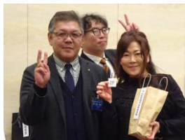
米山記念奨学委員長賞

理事・委員長・パストガバナーより景品をご提供頂きました。見事当たられた幸運な皆さんです。