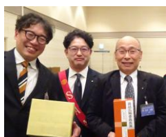
雑誌広報委員長賞