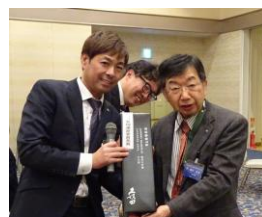
クラブ管理運営委員長賞